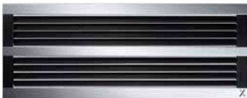
X-GRILLE Cover, 28 mm wide front border

Легко заменяют существующие решетки, благодаря стандартным монтажным типоразмерам